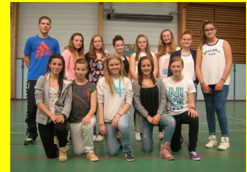
Section Sportive Féminine 2014/2015

La section sportive bénéficie des installations sportives de la ville de Caen et de son université, à proximité du Collège Jacques Monod.